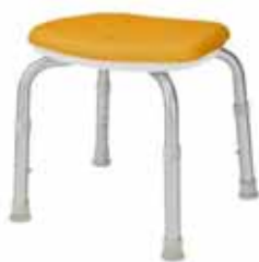
(背なしシャワーベンチ)