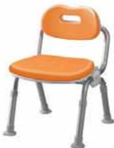
(背付きシャワーベンチ)